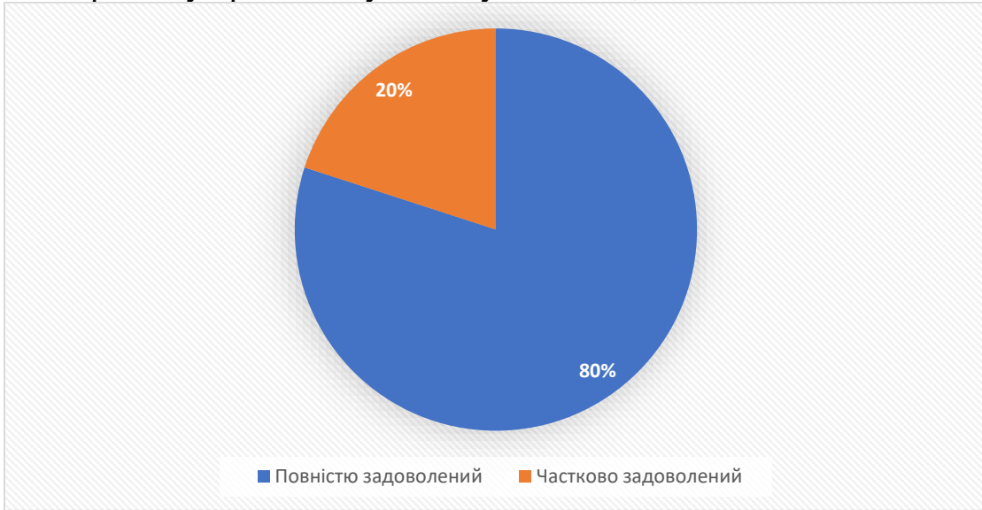
Рис. 4 Розподіл відповідей стейкхолдерів щодо професійних навичок студентів-практикантів

Розподіл відповідей на запитання: «Чи задоволені ви набутими професійними навичками студентів ЛДУФК імені Івана Боберського, що проходять практику/працюють у вашій установі?», %