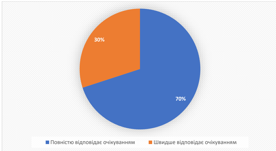
Рис. 6 Очікувана якість підготовки фахівців щодо формування необхідних компетентностей

На думку експертів освітня програма цілком забезпечує формування тих компетентностей, які потрібні фахівцям для ефективної роботи в установі/організації . Якість підготовки фахівців відповідає очікуванням.