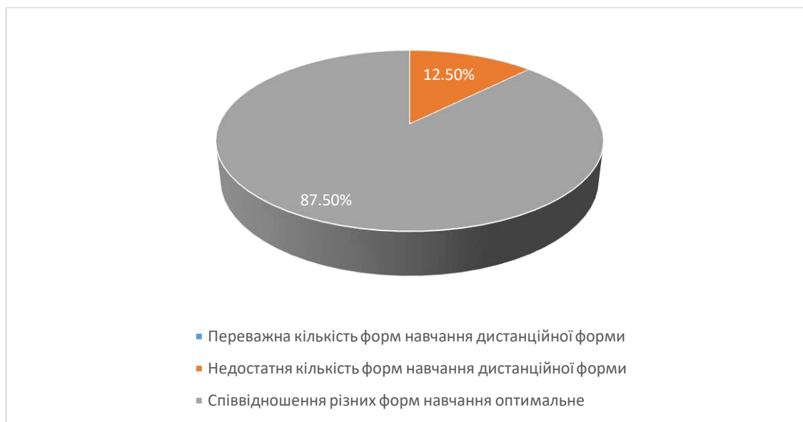
Рис.11 Сформулюйте свою думку щодо співвідношення дистанційних форм навчання (без контакту з викладачем) з навчальної дисципліни та форм навчання, що передбачають контакт з викладачем (аудиторні форми навчання або використання відеозв'язку).

В процесі опитування було з'ясовано, що для 87,5% студентів співвідношення різних форм навчання оптимальне, а для 12,5 % студентів недостатня кількість форм навчання дистанційної форми.