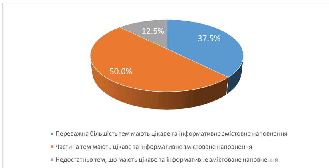
Рис. 2. Чи вдало підібрано змістовне наповнення тем навчальної дисципліни?

На 3 питання «Чи вдало підібрано змістовне наповнення тем навчальної дисципліни?» 50% студентів відповіли, що частина тем мають цікаве та інформативне змістовне наповнення, 37,5% вважають, що переважна більшість тем мають цікаве та інформативне змістовне наповнення, 12,5% вважають, що недостатньо тем, що мають цікаве та інформативне змістовне наповнення .