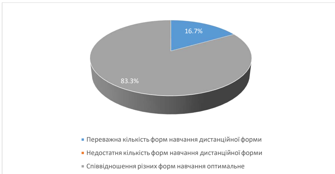
Рис.11 Сформулюйте свою думку щодо співвідношення дистанційних форм навчання (без контакту з викладачем) з навчальної дисципліни та форм навчання, що передбачають контакт з викладачем (аудиторні форми навчання або використання відеозв'язку).

Аналіз відповідей на запитання «Чи обрали б ви у майбутньому для вивчення іншу дисципліну, яку читає даний викладач?» показав 91,7% сказали, що обрали б, 8,3% сказали, що їм важко відповісти на це питання.