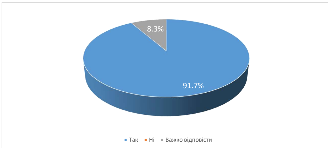
Рис. 12 Чи обрали б ви у майбутньому для вивчення іншу дисципліну, яку читає даний викладач?

Аналіз відповідей на запитання «Чи обрали б ви у майбутньому для вивчення іншу дисципліну, яку читає даний викладач?» показав 91,7% сказали, що обрали б, 8,3% сказали, що їм важко відповісти на це питання.