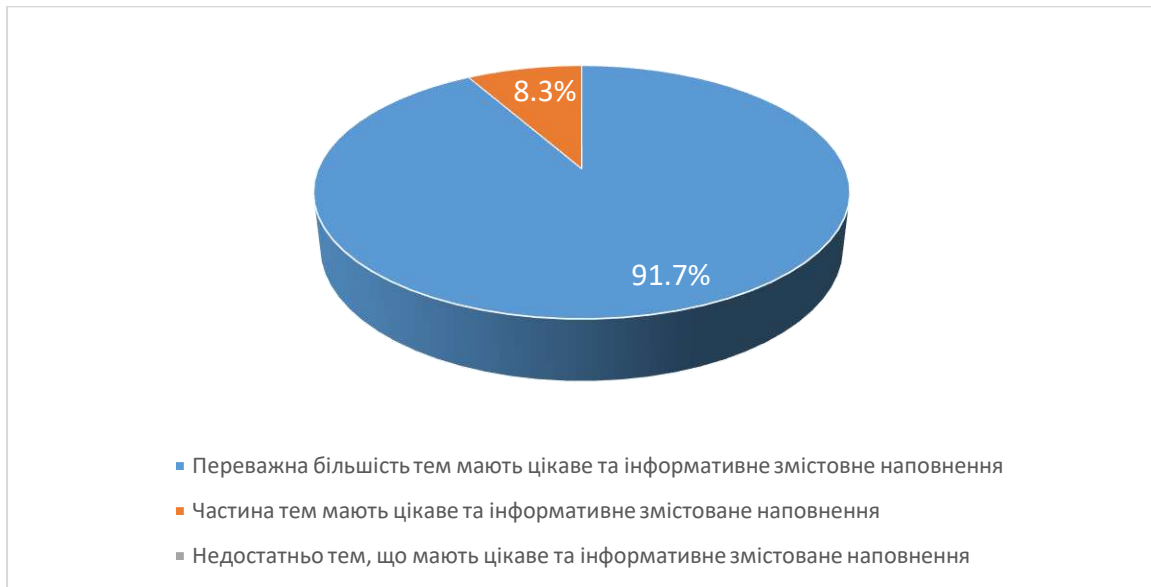
Рис. 2. Чи вдало підібрано змістовне наповнення тем навчальної дисципліни?

Під час відповіді на 4 питання анкети «Оцініть форми викладання навчальної дисципліни за 10-ти бальною шкалою (1 - застарілі; 10 – інноваційні)» студенти у середньому оцінили форму викладання навчальної дисципліни на 9,8 балів.