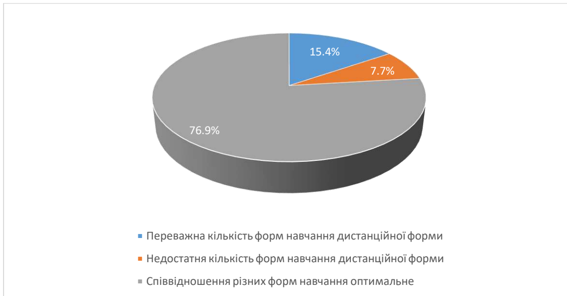
Рис.11 Сформулюйте свою думку щодо співвідношення дистанційних форм навчання (без контакту з викладачем) з навчальної дисципліни та форм навчання, що передбачають контакт з викладачем (аудиторні форми навчання або використання відеозв'язку).

Аналіз відповідей на запитання «Чи обрали б ви у майбутньому для вивчення іншу дисципліну, яку читає даний викладач?» показав 69,2% сказали, що обрали б, 30,8% сказали, що їм важко відповісти на це питання.