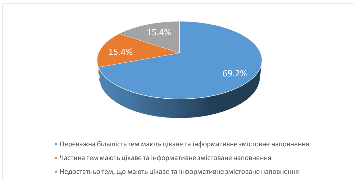
Рис. 2. Чи вдало підібрано змістовне наповнення тем навчальної дисципліни?

мають цікаве та інформативне змістовне наповнення та недостатньо тем мають цікаве та інформативне змістовне наповнення.