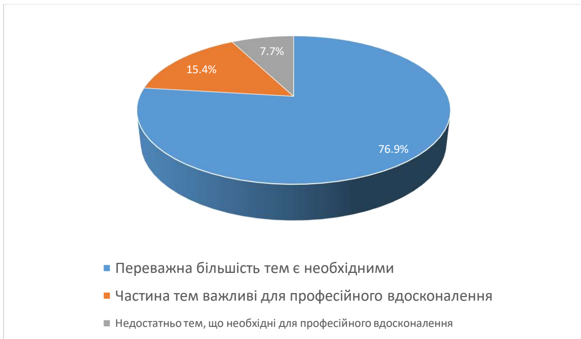
Рис. 1. Чи доцільно підібрана тематика навчальної дисципліни?

За результатами опитування на друге чи доцільно підібрана тематика навчальної дисципліни. Так 76,9% студентів відзначають, що переважна більшість тем є необхідними, 15,4% вказують, що частина тем важливі для професійного вдосконалення, 7,7% недостатньо тем, що необхідні для професійного вдосконалення.