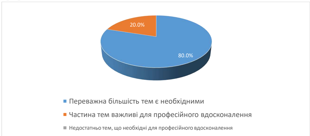
Рис. 1. Чи доцільно підібрана тематика навчальної дисципліни?

За результатами опитування на 2 питання «Чи доцільно підібрана тематика навчальної дисципліни.» Так 80% студентів відзначають, що переважна більшість тем є необхідними, 20% вказують, що частина тем важливі для професійного вдосконалення.