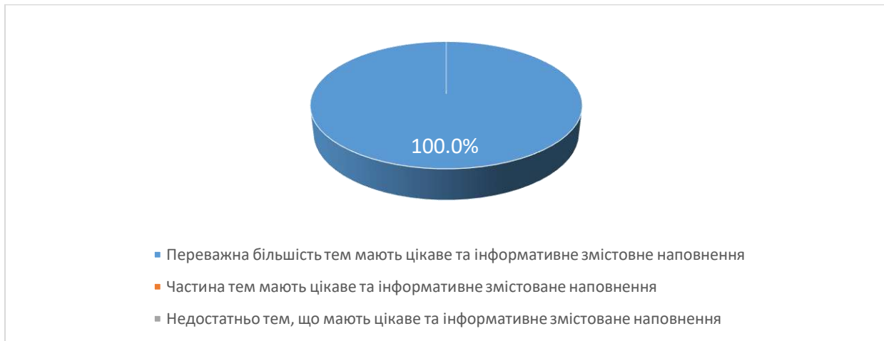
Рис. 2. Чи вдало підібрано змістовне наповнення тем навчальної дисципліни?

Під час відповіді на 4 питання анкети «Оцініть форми викладання навчальної дисципліни за 10-ти бальною шкалою (1 - застарілі; 10 – інноваційні)» студенти у середньому оцінили форму викладання навчальної дисципліни на 9 балів.