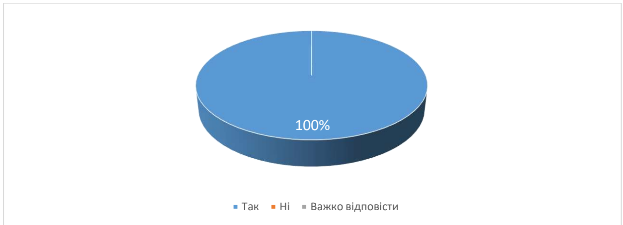
Рис. 8. Чи обрали б ви у майбутньому для вивчення іншу дисципліну, семінарські заняття (практичні/лабораторні заняття) з якої читає даний викладач?