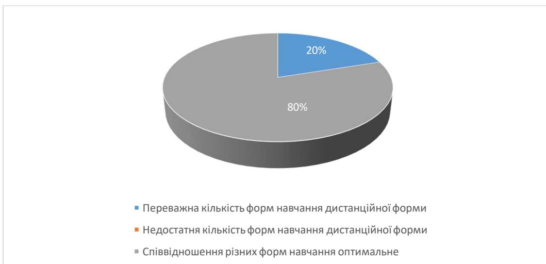
Рис.5. Сформулюйте свою думку щодо співвідношення дистанційних форм навчання (без контакту з викладачем) з навчальною дисципліною та форм навчання, що передбачають контакт з викладачем (аудиторні форми навчання або використання відеозв'язку).

На 8 питання анкети «Сформулюйте свою думку щодо співвідношення дистанційних форм навчання (без контакту з викладачем) з навчальною дисципліною та форм навчання, що передбачають контакт з викладачем (аудиторні форми навчання або використання відеозв'язку)». Так 80% студентів відзначили, що співвідношення різних форм навчання оптимальне; 20% студентів відповіли, що переважна кількість форм навчання дистанційної форми.