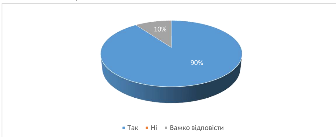
Рис.4. Чи поєднано в дисципліні теоретичний матеріал з сучасними прикладами з практики?

На 7 питання анкети «Чи поєднано в дисципліні теоретичний матеріал з сучасними прикладами з практики?». Так 90% студентів відповіли, що поєднано в дисципліні теоретичний матеріал з сучасними прикладами з практики; 10% студентів відзначили, що їм важко відповісти на питання.