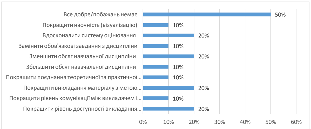
Рис. 6. Висловіть свої побажання щодо вдосконалення змісту навчальної дисципліни, роботи викладача, системи контролю тощо.

В процесі опитування на 13 питань «Чи обрали б ви у майбутньому для вивчення іншу дисципліну, лекційний курс з якої читає даний викладач?» було з'ясовано, що 100% студентів обрали б у майбутньому для вивчення іншу дисципліну, лекційний курс з якої читає даний викладач.