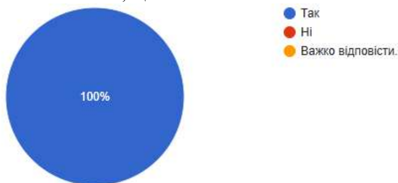
Рис. 4. Чи обрали б ви у майбутньому для вивчення іншу дисципліну, лекційний курс з якої читає даний викладач?

За результатами опитування на 13 питання чи обрали б ви в майбутньому для вивчення іншу дисципліну, курс лекцій з якої читає даний викладач? 100% опитаних студентів вважають, що так.