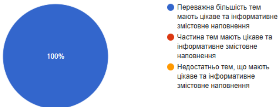
Рис. 2. Чи вдало підібрано змістовне наповнення тем навчальної дисципліни?

На 3 питання «Чи вдало підібрано змістовне наповнення тем навчальної дисципліни?» 100% вважають, що переважна більшість тем мають цікаве та інформативне змістовне наповнення.