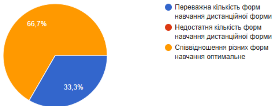
Рис.3 Сформулюйте свою думку щодо співвідношення дистанційних форм навчання (без контакту з викладачем) з навчальної дисципліни та форм навчання, що передбачають контакт з викладачем (аудиторні форми навчання або використання відеозв'язку).

В процесі опитування було з'ясовано, 66,7% студентів, вважають, що співвідношення різних форм навчання оптимальне; 33,3% відповіли, що переважна кількість форм навчання дистанційної форми.