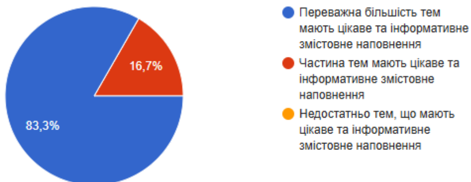
Рис. 2. Чи вдало підібрано змістовне наповнення тем навчальної дисципліни?

На 3 питання «Чи вдало підібрано змістовне наповнення тем навчальної дисципліни?» 83,3% вважають, що переважна більшість тем мають цікаве та інформативне змістовне наповнення, 16,7% студентів відповіли, що частина тем мають цікаве та інформативне змістовне наповнення.