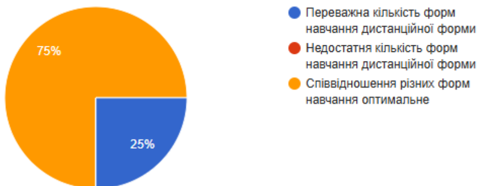
Рис.3 Співвідношення відповідей на питання «Сформулюйте свою думку щодо співвідношення дистанційних форм навчання (без контакту з викладачем) з навчальної дисципліни та форм навчання, що передбачають контакт з викладачем (аудиторні форми навчання або використання відеозв’язку)».

В процесі опитування було з’ясовано, що для 75% співвідношення різних форм навчання оптимальне; 25% студентів вважають, що переважна кількість форм навчання дистанційної форми.