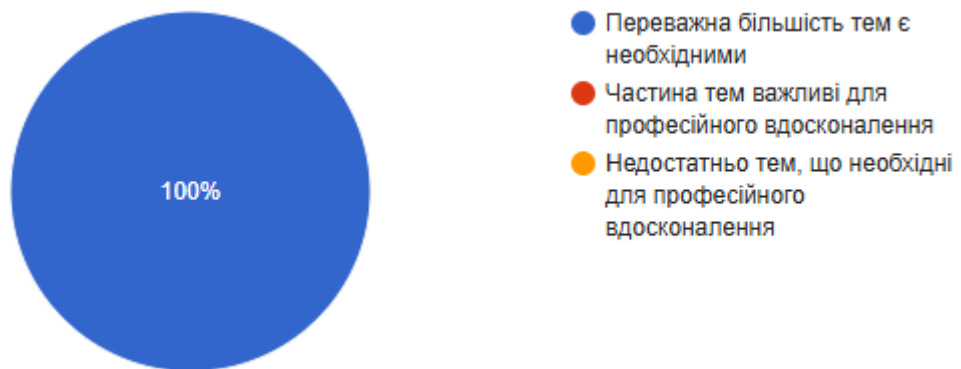
Рис. 1. Чи доцільно підібрана тематика навчальної дисципліни?

За результатами опитування на друге чи доцільно підібрана тематика навчальної дисципліни. Так 100% студентів відзначають, що переважна більшість тем є необхідними.