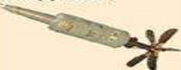
кумулятивний танковий снаряд калібру 125 мм