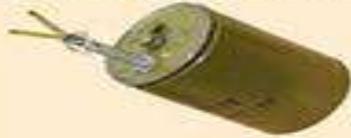
протипіхотна вистрибуваюча осколкова міна ОЗМ-72