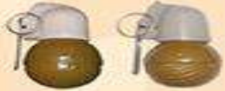
ручна протипіхотна ударно-дистанційна граната РГН/РГО