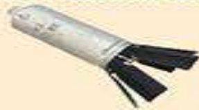
осколковий касетний бойовий елемент 9Н210