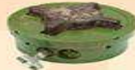
протипіхотна міна ПМН-2