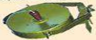
МОН-100 протипіхотна осколкова міна спрямованої дії