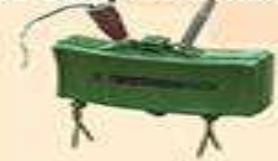
МОН-50 протипіхотна міна спрямованої дії