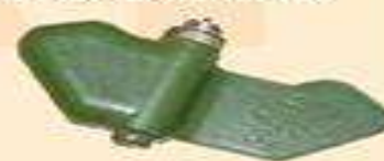
протипіхотна міна ПФМ-1 "Пелюсток"