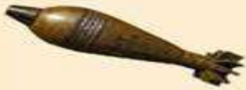
мінометна міна 82 мм