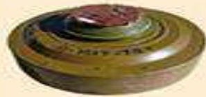
протитанкова міна ТМ-62М