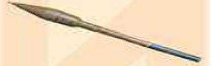
кумулятивний гранатометний снаряд ПГ-7В