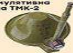
протитанкова кумулятивна міна ТМК-2