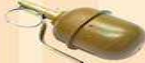
ручна протипіхотна уламкова граната РГД-5