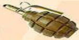
ручна осколкова граната Ф-1