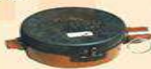
протипіхотна міна ПМН