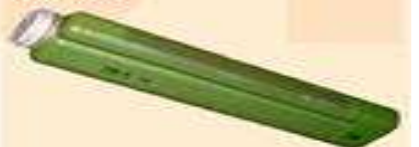
протитанкова міна ПТМ-1